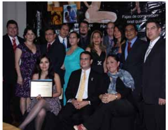
Miembros activos SNCP y Junta Directiva.