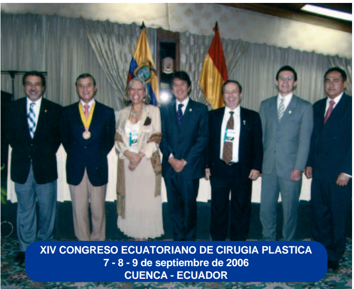
XIV CONGRESO ECUATORIANO DE CIRUGIA PLASTICA 7 - 8 - 9 de septiembre de 2006 CUENCA - ECUADOR