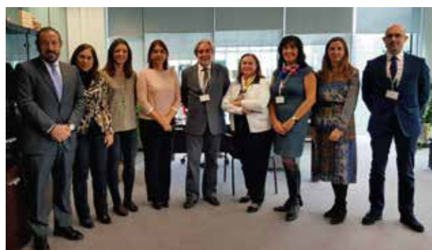
Representantes de la AEMPS y de la SECPRE en la sede de la Agencia del Medicamento.

A principios de enero de 2018 los profesionales podrán empezar a introducir la información relativa a las intervenciones que realicen con implantes mamarios y a su comportamiento, que será "convenientemente analizada con el fin último de velar por la seguridad de las personas portadoras de los mismos".