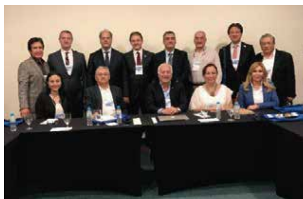
Reunión de Consejo Ejecutivo de la FILACP con los presidentes y representantes de Argentina, Brasil, Chile, Paraguay, como invitada la Sociedad Peruana y los organizadores del XXII Congreso Ibero Latinoamericano.

Así también se informó sobre la programación del próximo Congreso Ibero-Latinoamericano de Lima – Perú 2018.