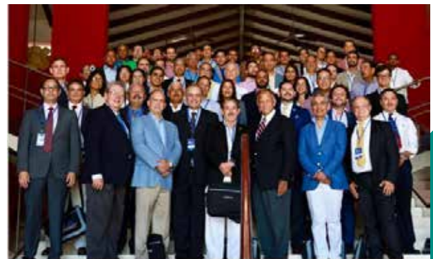
Autoridades de SODOCIPRE y de FILACP, Profesores internacionales y asistentes al Congreso.

El Congreso culminó con una cena de gala bailable junto a la orquesta de Los Hermanos Rosario en un ambiente de alegría y camaradería.