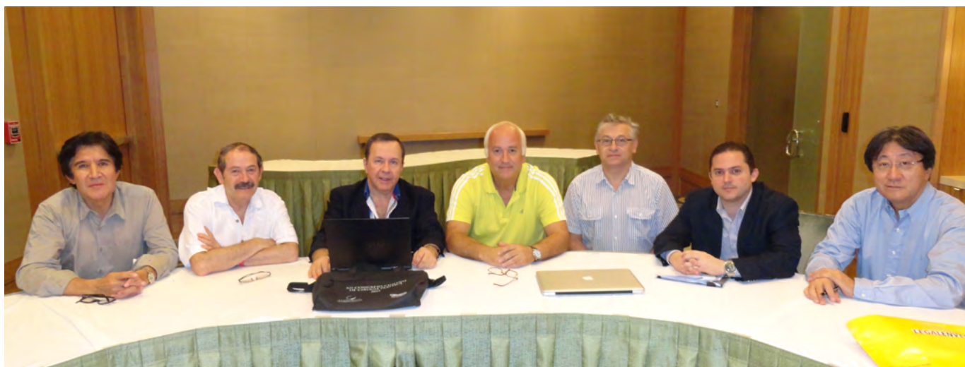
Acima: Reunião de Trabalho do Comitê diretivo.