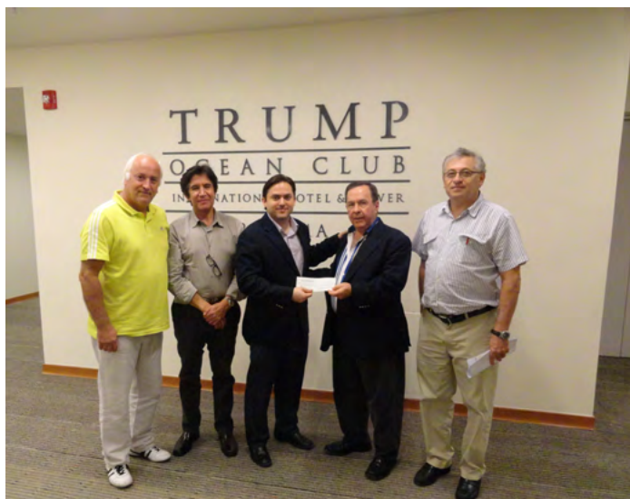
Direita: Entrega do contrato com a empresa de eventos do Hotel Trumpp, para a realização do Congresso da América Central e do Caribe de 31 de Outubro a 02 de Novembro no Panamá.